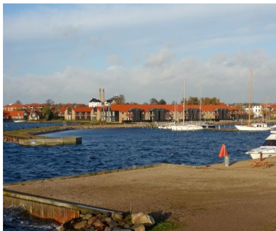
Figur 2 Frederikssund Havn (udsnit) med "Operapladsen" i forgrunden