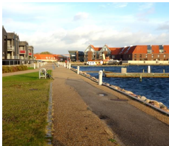
Figur 3 Frederikssund Havn, Nordkajen