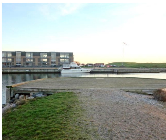
Figur 4 Vestmolen og dens runde molehoved mod syd