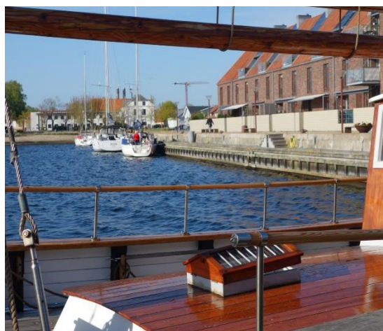
Figur 5 Frederikssund Havn, Østkajen